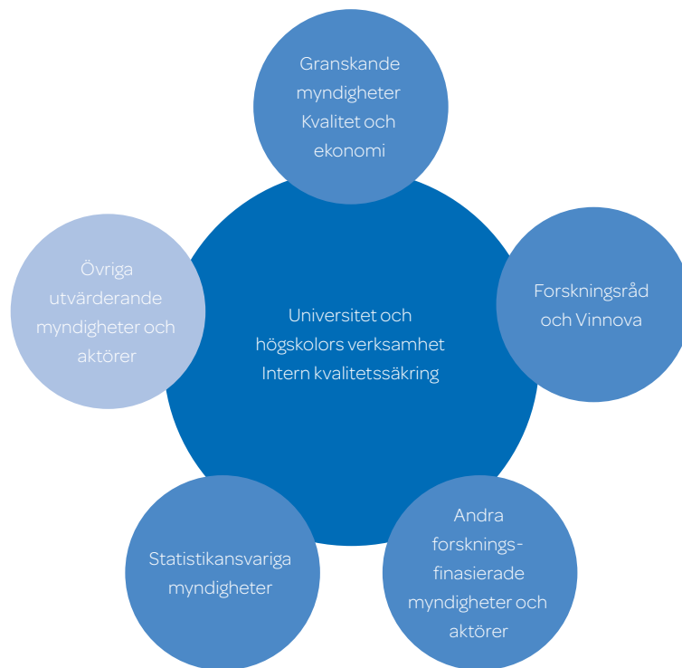
Figur 1. Aktörer inom utvärdering och uppföljning av högskolors och universitets verksamhet